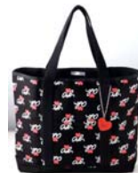
アニエスベー 1,200円(税込)