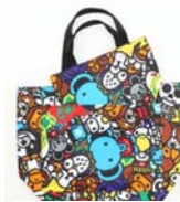
ベイブ キッズ 1,800円(税込)