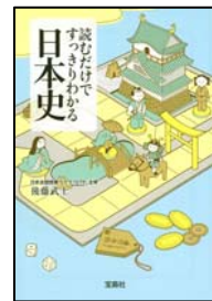
宝島社文庫 『読むだけですっきりわかる日本史』 著者：後藤武士 発売日：2008年6月5日 定価：500円(税込)