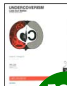
アンダーカバリズム 1,800円(税込)