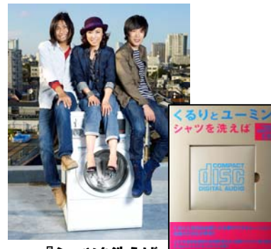
『シャツを洗えば』 発売日: 2009年12月25日 価格: 680円(税込)

くるりと松任谷由実がコラボレーションした新曲、『シャツを洗えば』を発売。メジャーアーティストが新曲を、書店、コンビニ流通で発売するのは史上初めての試みです!