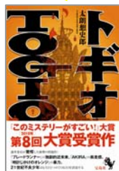
『トギオ』 太郎 想史郎 著

★第8回『このミス』大賞は2作品が受賞! いずれも1月8日発売、定価1,470円(税込)