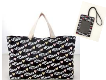
ブランドアイテム： cherビッグトート&バスケース

2010年も「28歳、一生“女の子”宣言！」を コンセプトにますます部数を伸ばします！