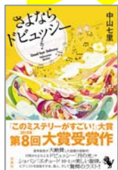
『さよならドビュッシー』 中山七里 著