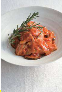
チキンの トマト煮込み