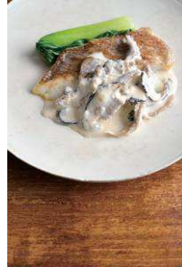
白身魚の きのこ クリームソース