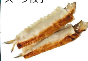
子持ちししゃも 整列餃子