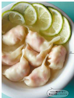
はんぺん桜えび スープ餃子

『うまい餃子』 定価：本体800円＋税 発売日：2017年6月23日 判型：A5 ページ数：112