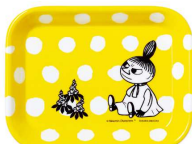
付録3 リトルミイの 水玉トレイ (小) サイズ:タテ10×ヨコ12.8cm