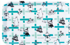
付録2 ムーミンと 仲間たちのトレイ (大)

サイズ(約): タテ10×ヨコ21.5×マチ2.5cm チャーム&チェーンの長さ8.5cm