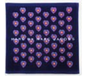
マーク BY マーク ジェイコブス 1,260円(税込)