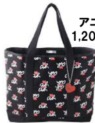
アニエスベー 1,200円(税込)