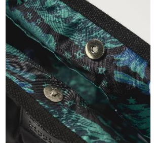
▲開閉しやすい マグネットボタン