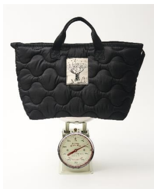
▲りんごより軽い約210g