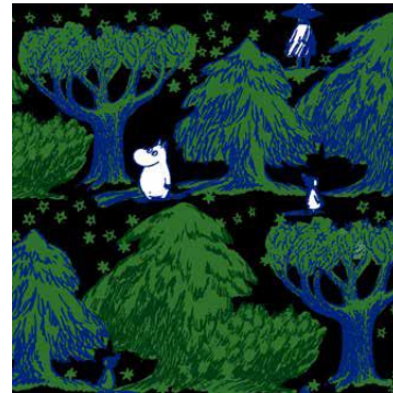
▲内生地はコラボ限定 柄「Starry Valley」