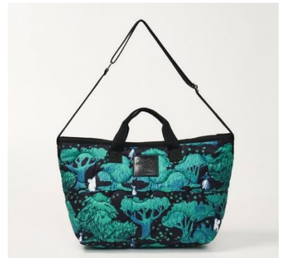
■キルティングバッグ