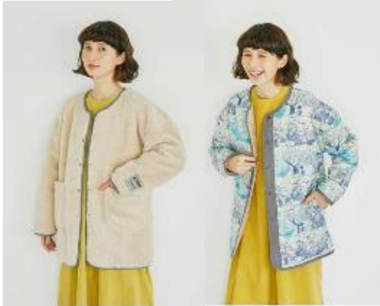
■リバーシブルボアジャケット