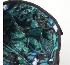
▲スマホも入る 内ポケット2つ