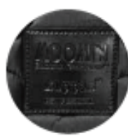
▲どちらの面も使える 両A面仕様