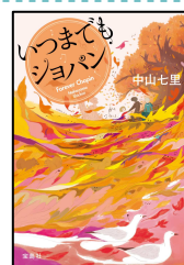
『いつまでもショパン』