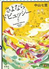
『さよならドビュッシー』