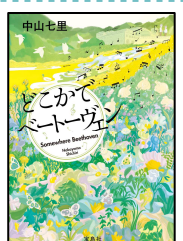
『どこかでベートーヴェン』