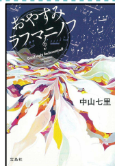
『おやすみラフマニフ』