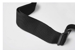
タフなショルダーベルト