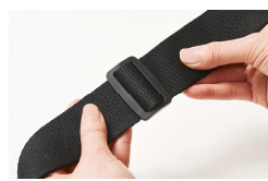
ベルトはサイズ調整可能