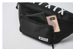
便利な立体ポケット