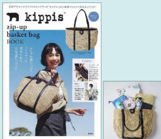
『kippis® zip-up basket bag BOOK』

『kippis®』とは、フィンランド語で「乾杯」の意味。一日の終わり、ほっと解き放たれるような感覚をくれる「乾杯」の瞬間は、日々の暮らしのごほうびのようなもの。そんな温かなひと時をイメージして、デザインを展開しています。これまでバッグブランド「レスポートサック」や川辺（株）、一広（株）など多種多様な企業にデザイン提供を行っています。