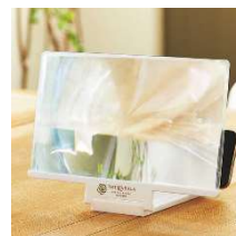
『素敵なあの人』10月号 発売日:2021年8月16日 特別定価:950円(税込)