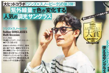
<ジンズ×スノーピーク Rubber SUNGLASSES Multi Occasion>