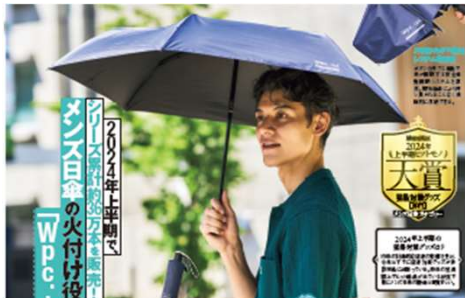
<Wpc. IZA オートマティック&セーフ>