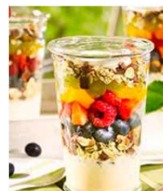
栄養たっぷりのシリアル