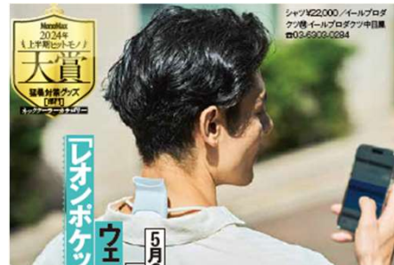
<ソニー REON POCKET 5 センシングキット>